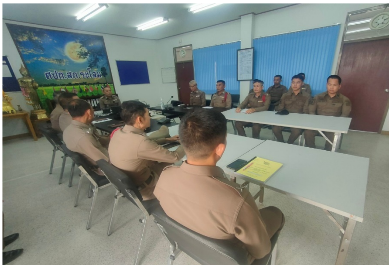
รูปถ่ายผลการดำเนินงานจริง